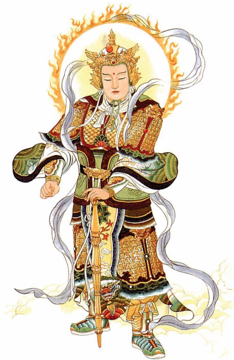
NAM MÔ HỘ PHÁP VI ĐÀ TÔN THIÊN BỒ TÁT